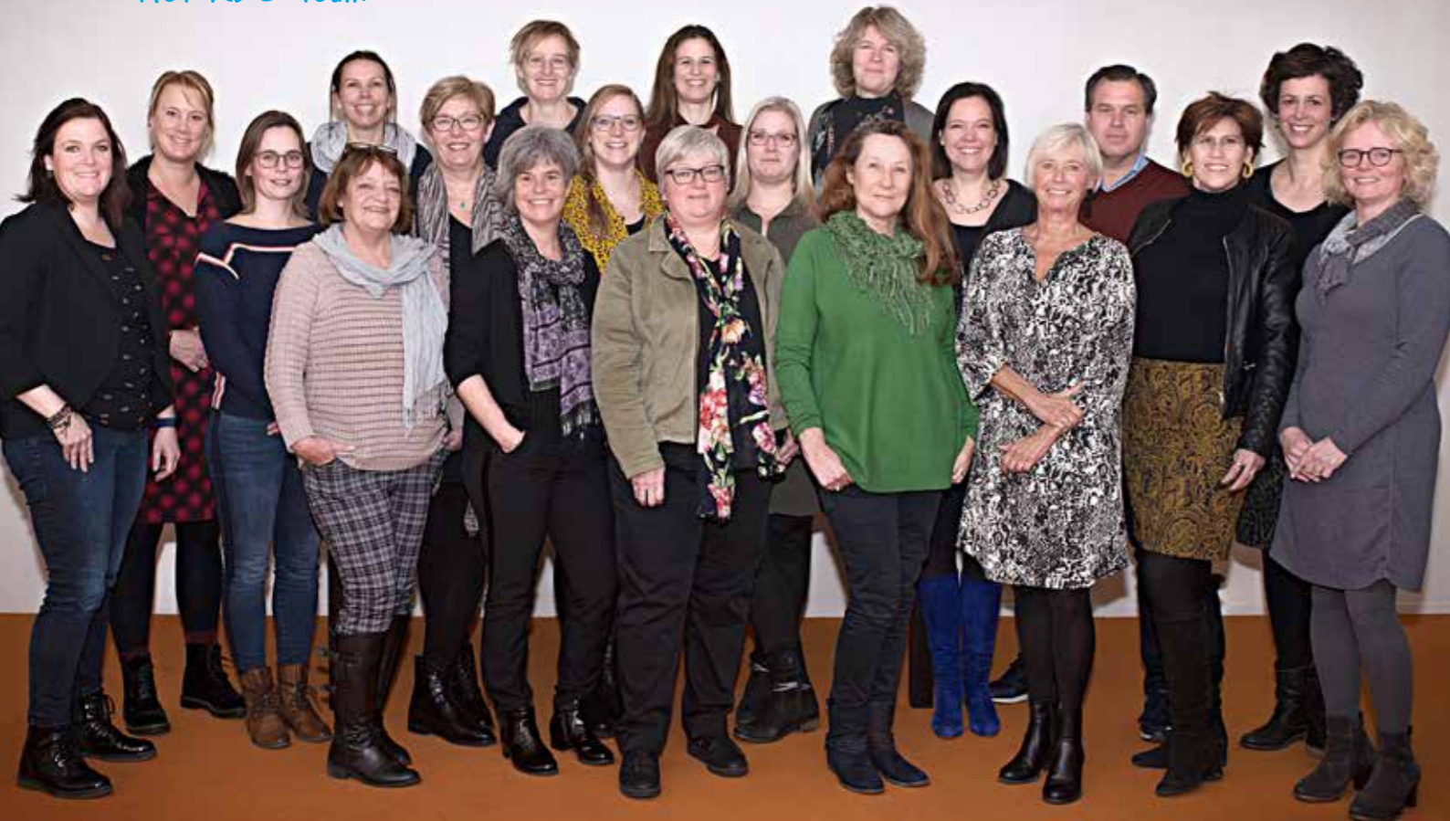
Het KEC team