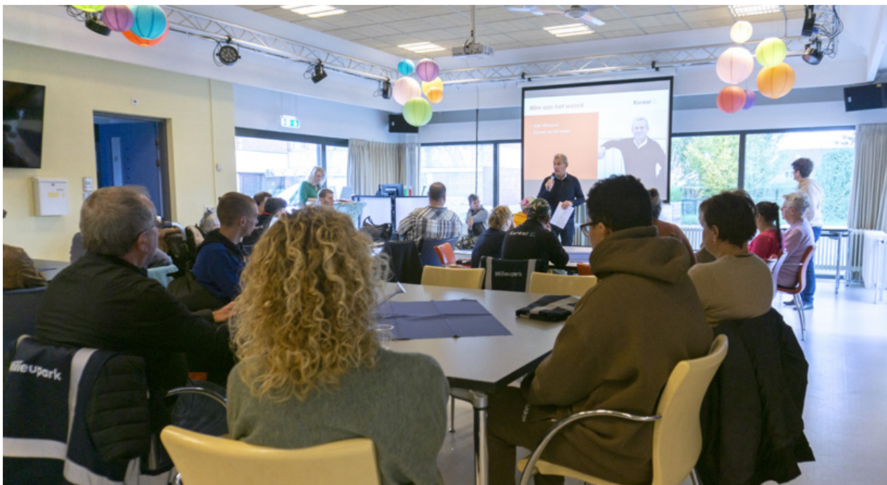
Tijdens de Grote Vergadering kunnen alle cliënten van regio NML meepraten.

Grote Vergadering. Deze vindt ook om de zes weken plaats. En hierbij kunnen alle cliënten aansluiten om hun mening te geven over bepaalde onderwerpen. Zo hebben we met elkaar gesproken over wat we vonden van de zomerfeestweek. En hebben we gezamenlijk de naam gekozen voor het nieuwe mileupark.